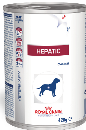
Lata de 420 g