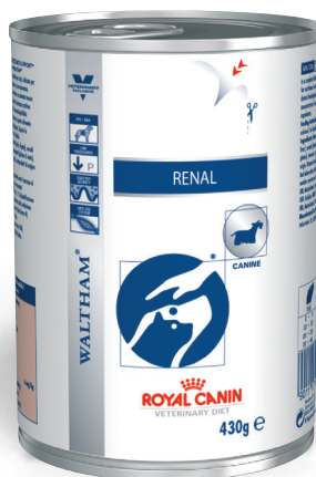
Lata de 430 g